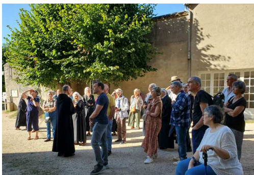
Visite à Saint Benoît-sur-Loire