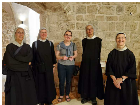
A Jaffa, près du lieu de la vision de Pierre