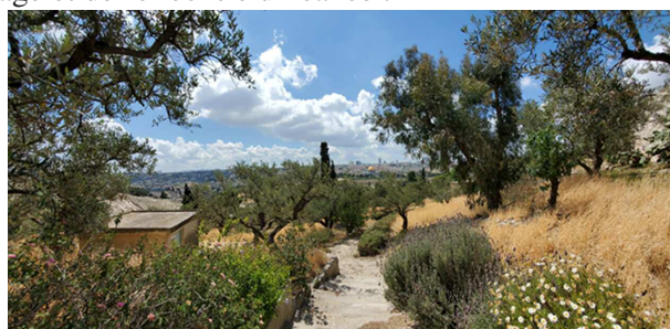
Jardin du Mont des Oliviers, au fond la Vieille Ville