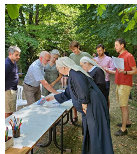
La Fresque du climat