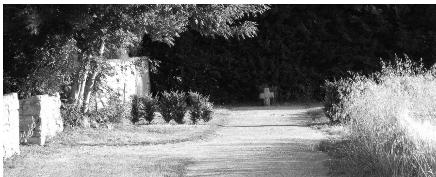
Notre cimetière avec une croix venant de Kerbénéat

En 2002 , nous avons installé le noviciat dans le grenier de la maison d'origine et dans la grange côté EST, deux parloirs, lieux de rencontre avec les parents et visiteurs ; à l'étage, deux ateliers et un ermitage pour la communauté. Depuis 2003 , des allées empierrées sillonnent notre jardin et des parterres de fleurs et d'arbustes agrémentent l'ensemble. Des scouts ou des groupes de jeunes viennent remonter les murs en pierre de notre jardin. Une partie n'est pas encore terminée, les volontaires seront les bienvenus.