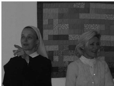
Mère Prieure et sa sœur

Les emplois ont été marqués par « la révolution technologique » qui se fait sentir particulièrement à l'imprimerie. Avec l'aide d'une amie, consultante en entreprise, l'atelier a été réorganisé. Peu à peu, par la force des choses, les ordinateurs rentrent dans nos modes de travail et de relations ; nous avons créé un site internet.