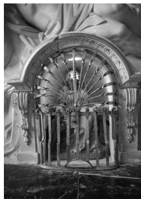
Statue de Notre-Dame des Ardilliers

C'est là que le Père Joseph du Tremblay, capucin, eut l'intuition en 1606 qu'il devait aider notre fondatrice, Madame Antoinette d'Orléans de Longueville, alors abbesse coadjutrice de l'Abbaye de Fontevraud, dans son désir de réforme. Cette aide se concrétisera avec la fondation de notre congrégation le 25 octobre 1617, à Poitiers.