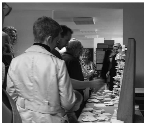
Lors de la visite de l'imprimerie

Le 17 septembre , dans le contexte de la journée du patrimoine, nous avons ouvert nos portes aux gens de Prailles et des environs, à notre entourage, et aux personnes avec qui nous tissons des liens de proximité. Occasion de faire percevoir un peu ce qui se passe derrière « nos murs », pour certains de découvrir les transformations depuis notre arrivée.